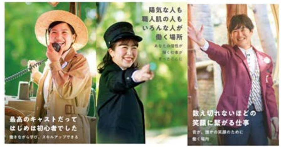
東京ディズニーリゾートキャストセンターホームページ