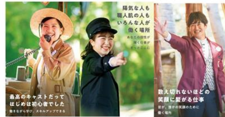
東京ディズニーリゾート・キャストセンター ウェブサイト